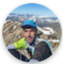
Sherpa Life - by J...